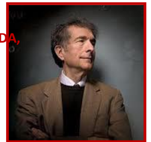
HODWARD GARDNER Autor de la “Teoría de las inteligencias Múltiples”